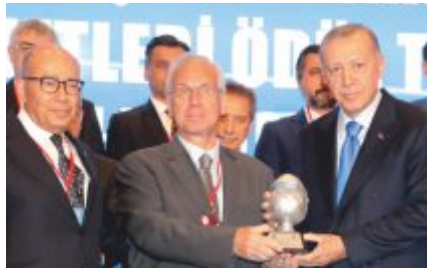
TEMLSU Demir İNÖZÜ Yönetim Kurulu Başkanı